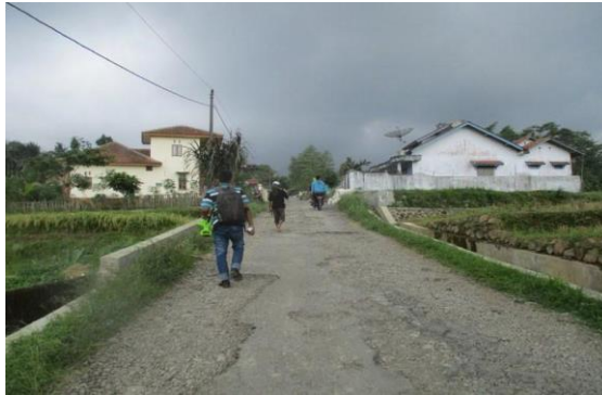
Gambar 3. Ruas Jalan Banjaratma – Bulakamba, Kec. Bulakamba

ketanggungan Sebagai objek penelitian adapun gambar kondisi jalannya seperti pada gambar di bawah ini: