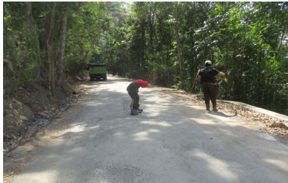
Gambar 4. Ruas Jalan Sitanggal – Larangan, Kec. Larangan