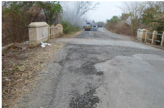
Gambar 5. Ruas Jalan Ketanggungan – Baros, Kec. Ketanggungan